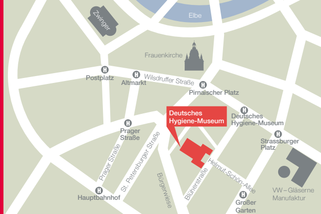
Ab Hauptbahnhof Tram 10 bis „Großer Garten“; Linien 1, 2, 4, 12 bis „Deutsches Hygiene-Museum“; Linie 13 bis „Großer Garten“

Und morgen ins Museum! ist eine Veranstaltung im Rahmen des Modellprojektes Kulturelle Bildung – Lernen im Museum, gefördert vom Beauftragten der Bundesregierung für Kultur und Medien sowie vom Sächsischen Staatsministerium für Kultus und Sport.